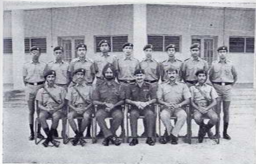
THE SCHOOL CADET APPOINTMENT HOLDERS (THE TORCH BEARERS !)