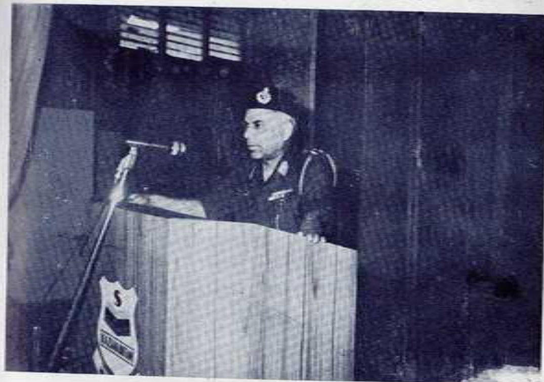
BRIG. CHITRANJAN SAWANT, VSM INSPECTOR, SAINIK SCHOOLS ADDRESSING THE STUDENTS AND STAFF