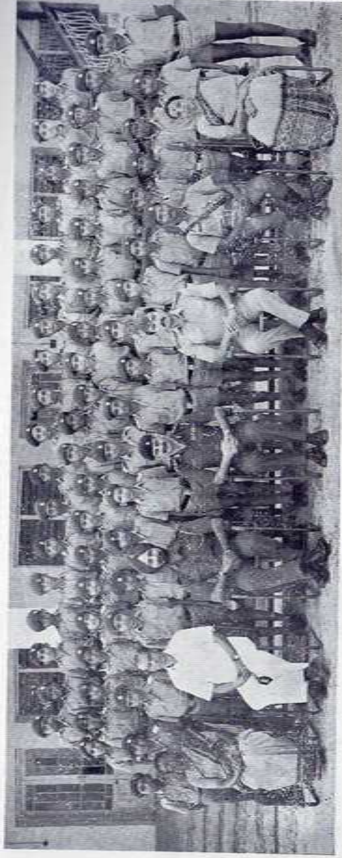
THE FRESHERS (Std. VI) VELUTHAMPI HOUSE