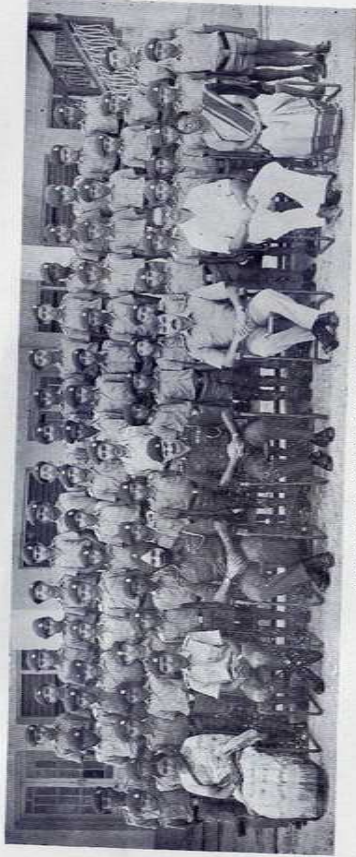
THE FRESHERS (Std. VI) VALLATHOL HOUSE