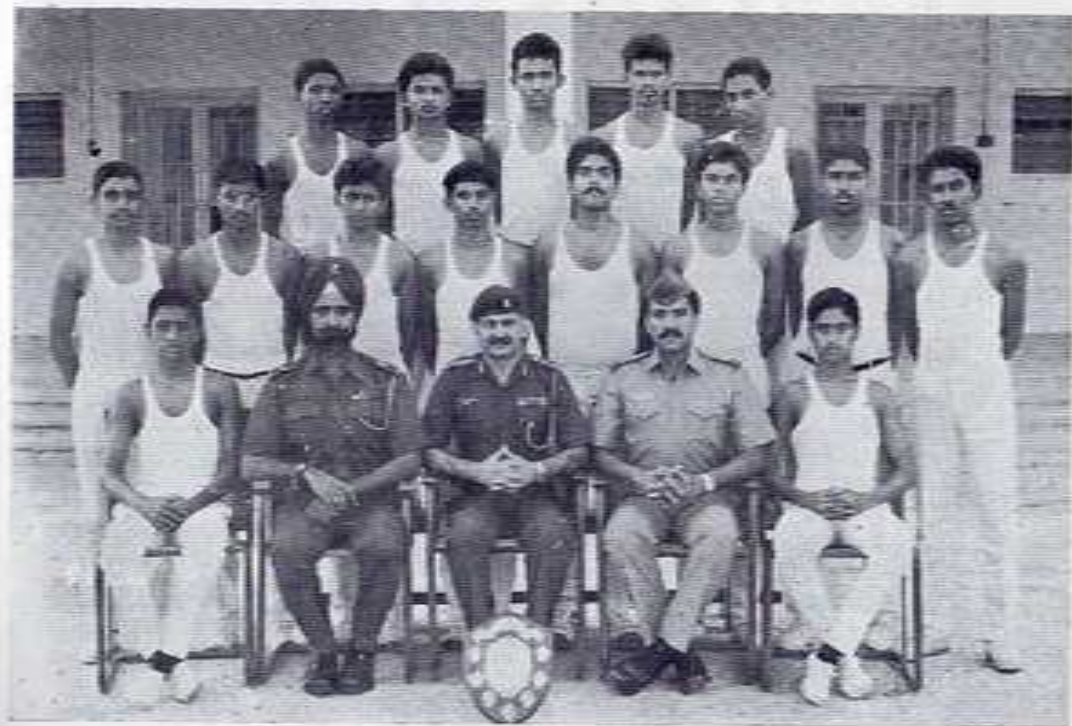
THE SCHOOL ATHLETIC TEAM