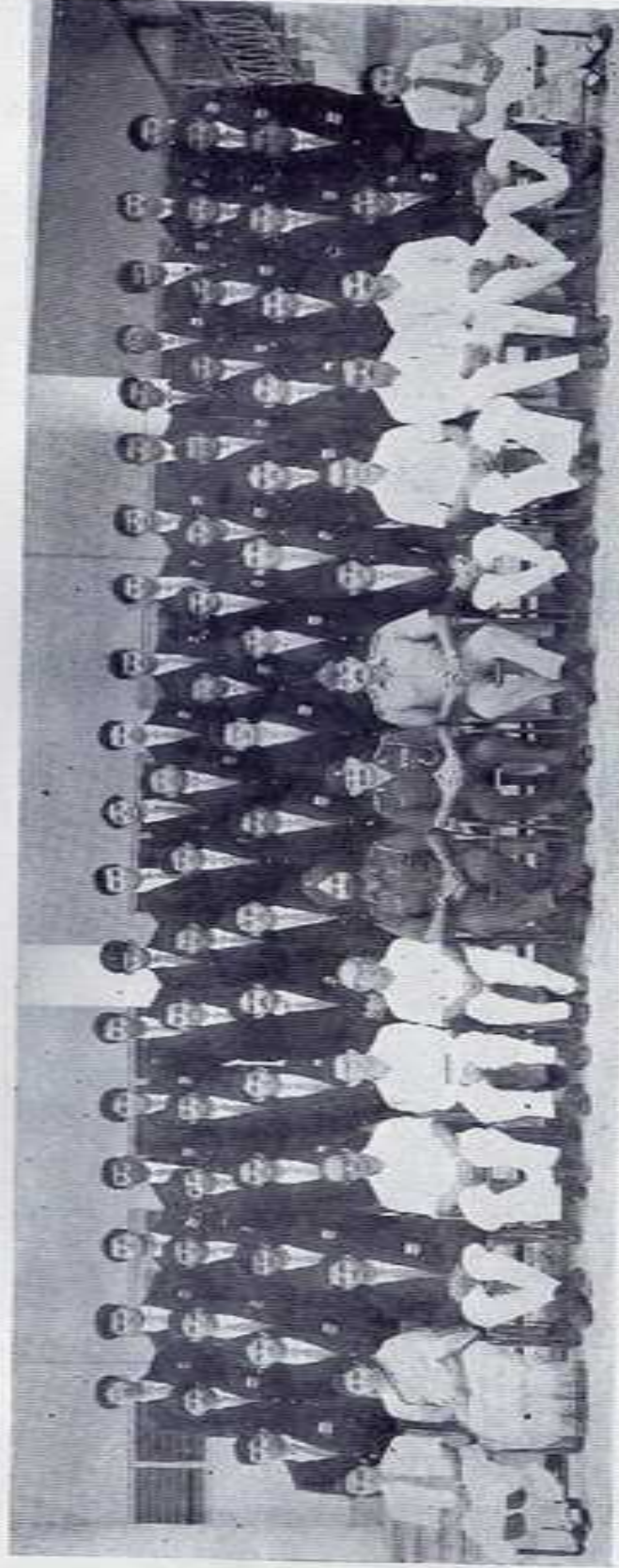
THE OUTGOING SAINIKS (Std. XII)