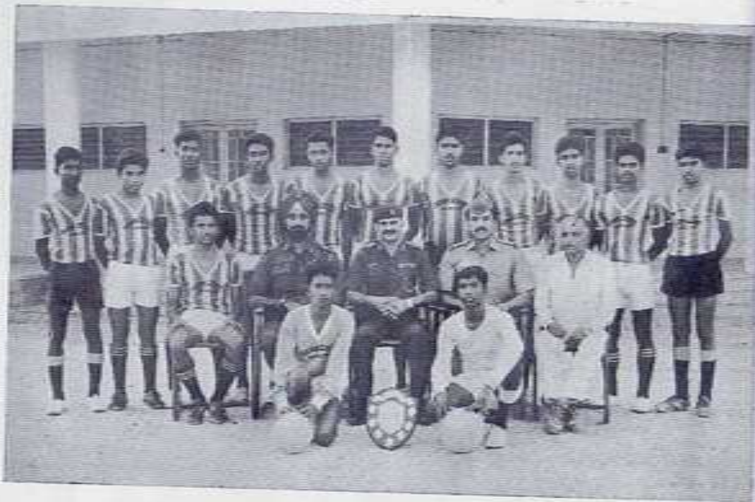
THE SCHOOL FOOT BALL TEAM — ONCE AGAIN KICKED THEIR WAY TO GLORY!