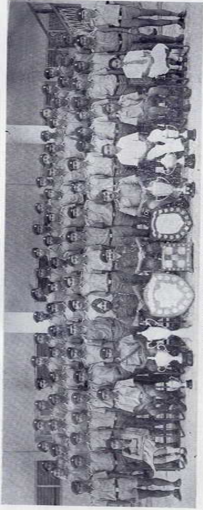
THE SHIVAJI SENIORS — SENIOR COCK HOUSE