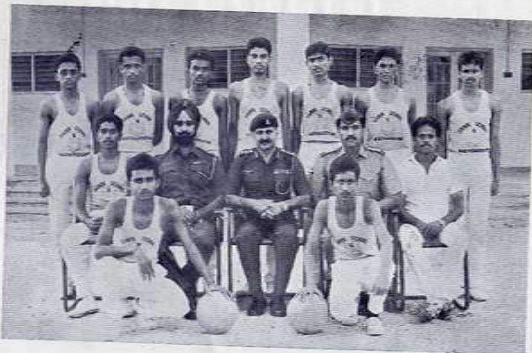
THE BASKET BALL TEAM