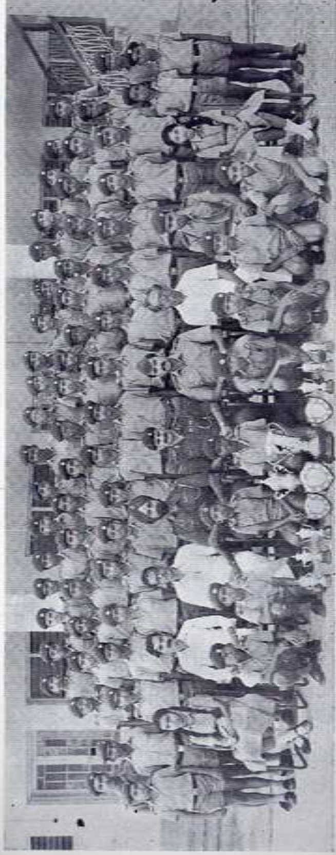
THE PRASAD JUNIORS — JUNIOR COCK HOUSE