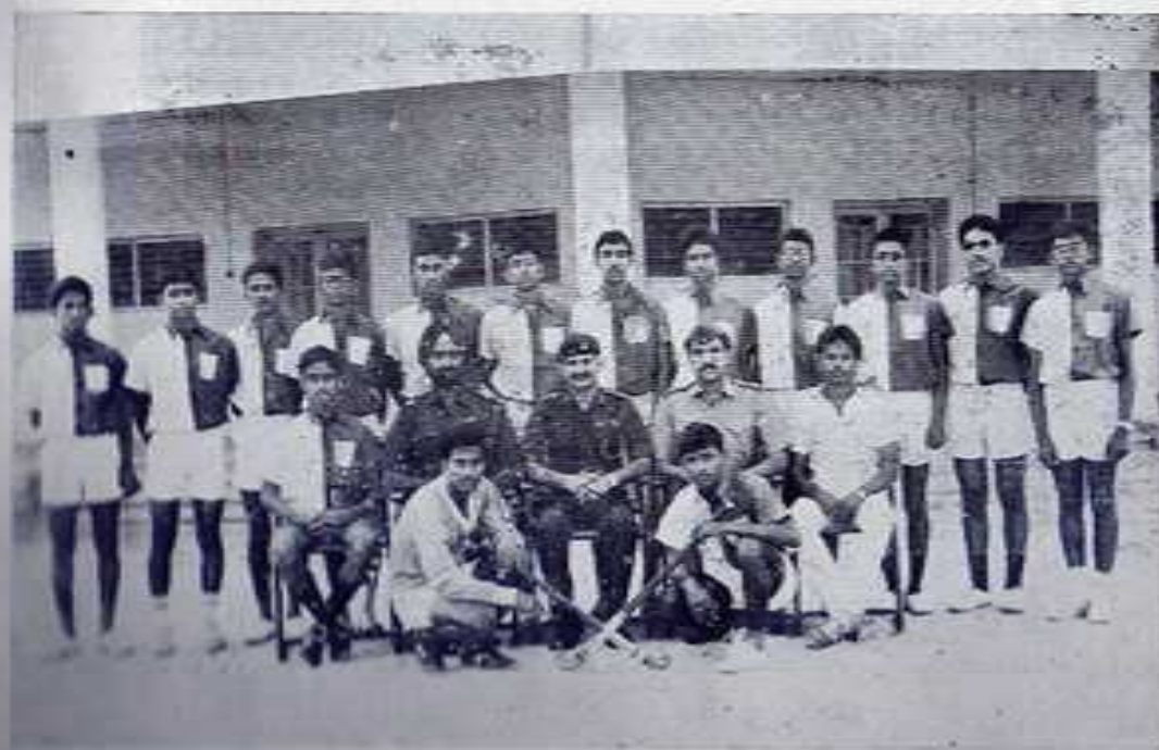
THE SCHOOL HOCKEY TEAM