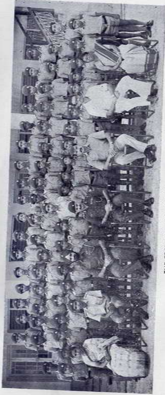
THE FRESHERS (Std. VI) VALLATHOL HOUSE