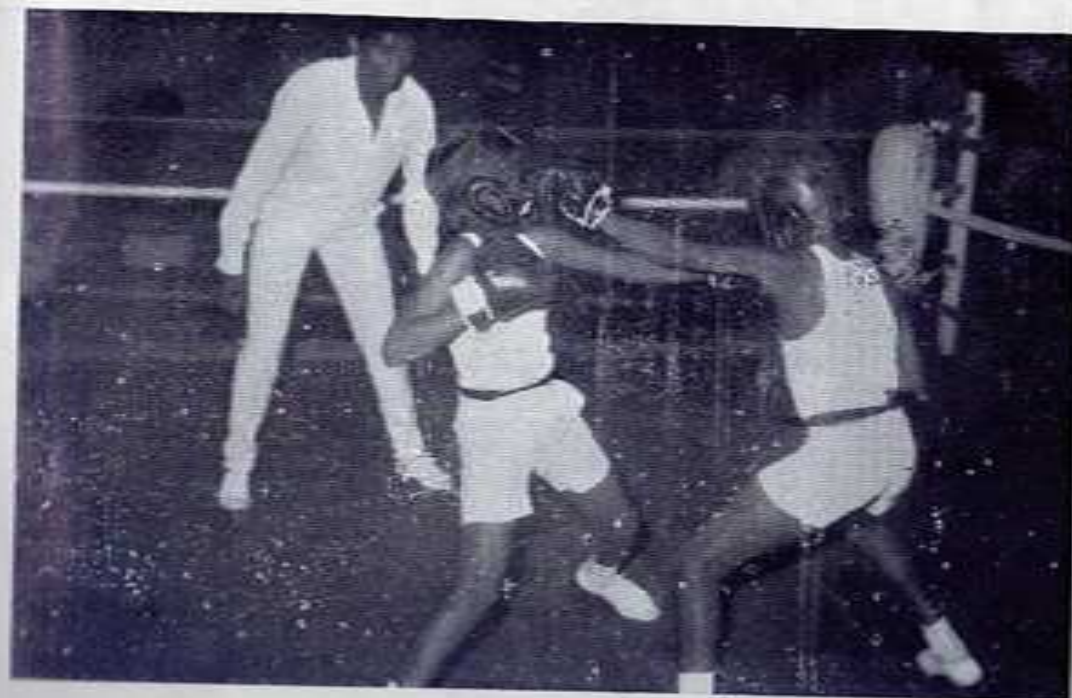
BOXING (THE ISSUE STILL IN DOUBT !)