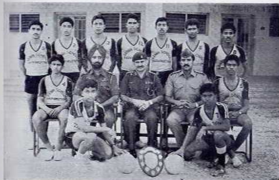
THE VOLLEY BALL TEAM